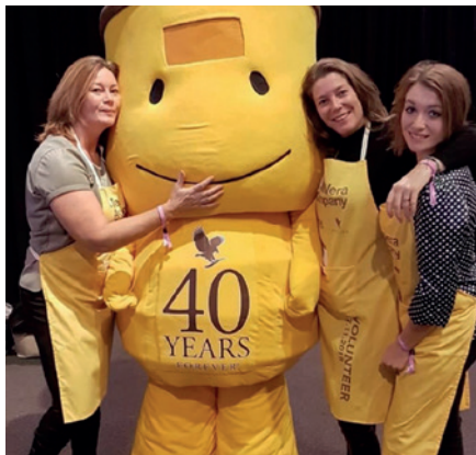
heawealth (Stockholm, Schweden)

„Forever Giving..... tonnenweise Nahrung wird verpackt und gespendet.“